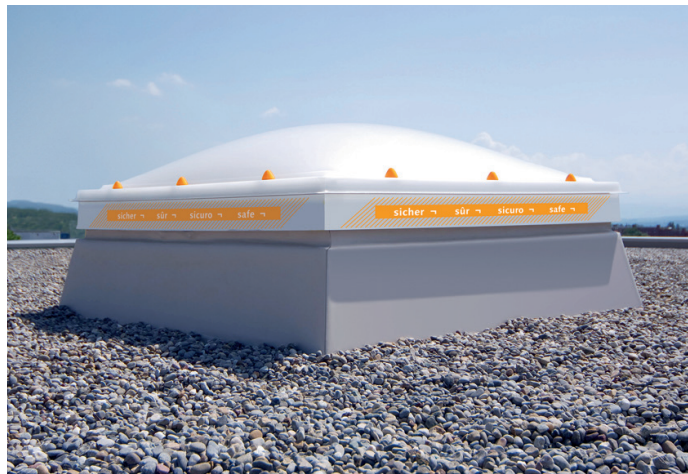
Bild 03: Die multiperform® auf einem klassischen konischen oder vertikalen Aufsetzkranz: Die äussere Lichtkuppel ist mit den Cupolux-typischen Verschraubungen auf dem Isolierrahmen montiert. Um sie von nicht durchbruch-sicheren Lichtkuppeln zu unterscheiden, wird sie extra als «sicher» markiert. Selbstverständlich kann multiperform® auch auf den kompakten Minizargen montiert werden.